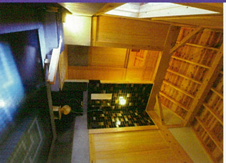
賞切風呂「翡翠・ひすい」(無料)

すべての浴場は源泉100%掛け流しで、泉質は弱アルカリ性単純泉です。 効能は神経痛、疲労回復、肌にも優しい泉質ですので美肌効果もございます。