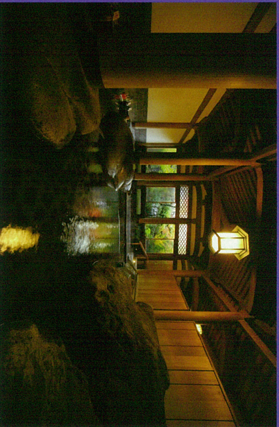
文化財大浴場「天平大浴堂」