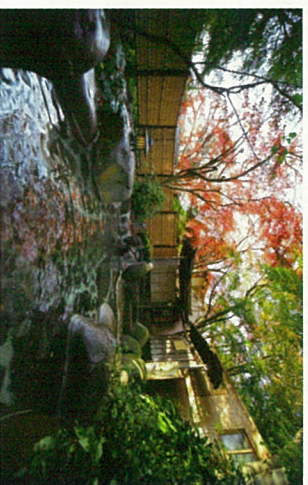
野天風呂「木洩れ日の湯」

大浴場 天平大浴堂(文化財風呂)・あやめの湯 露天風呂 木洩れ日の湯・折節の湯 雪花 賞切風呂 睡蓮(有料¥1100)・翡翠(無料) 泉質 アルカリ性単純温泉 効能 神経痛・筋肉痛・関節痛・五十肩など