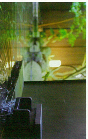
露天風呂「折節の湯」 雪花・せっか」